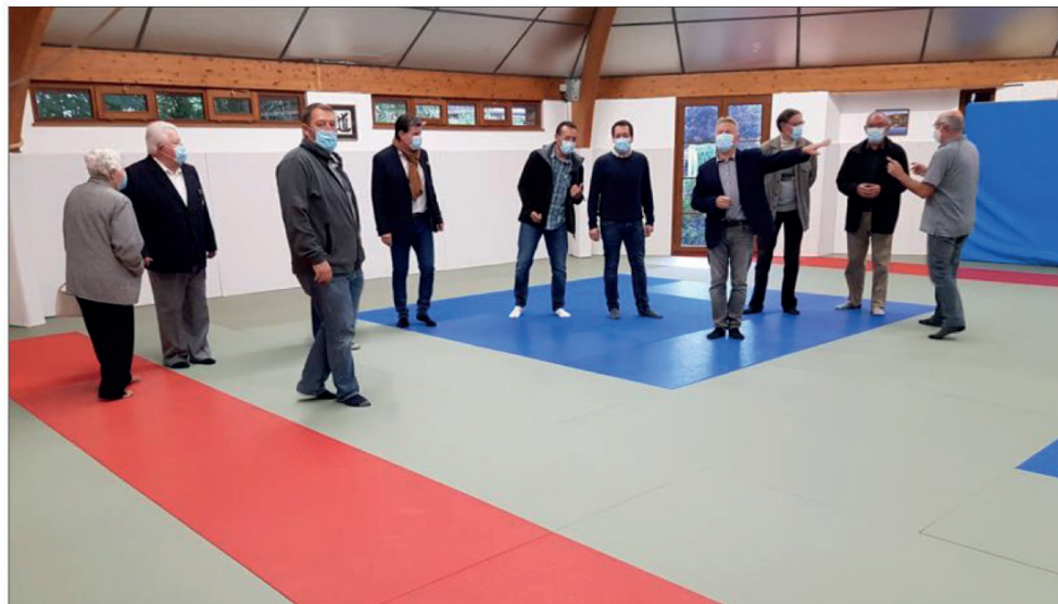
Un dojo flambant neuf.

Sur le côté se trouve le « kamiza », qu'il faut saluer en début de cours afin de souhaiter bonne vie au club. Y figurent les fondateurs de différentes disciplines, comme l'aïkido ou le judo. Roland Rutyna, président du club et ensei-